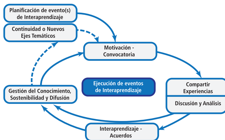
Figura N° 1 Esquema de conceptual de Interaprendizaje Interinstitucional

En la Figura 1. Se presenta el esquema de la metodología de ejecución de ciclos de interaprendizaje que involucra la planificación y convocatoria a pares institucionales, la realización de eventos de interaprendizaje por área temática, y la gestión del conocimiento.